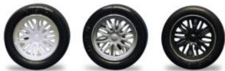
5422 - Ø 17mm BBS white